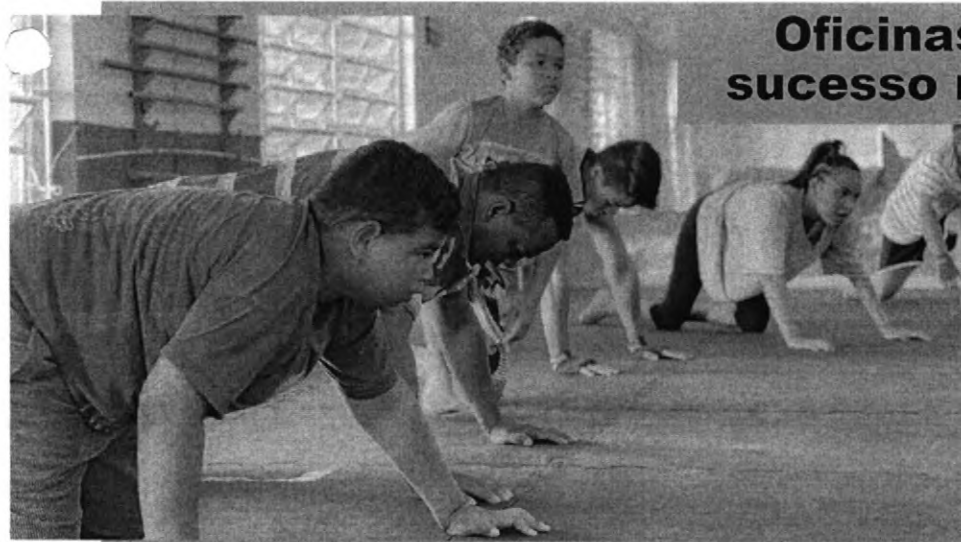
Alunos da oficina de kickboxing oferecida gratuitamente pela Prefeitura de Ibiúna fazem aquecimento durante aula

Uma parceria entre a Prefeitura de Ibiúna, através da Secretaria de Indústria e Comércio, e o Senai (Serviço Nacional de Aprendizagem Industrial), formou 23 alunos nos cursos de costura e modelagem. A formatura e entrega dos certificados aconteceu nesta sexta-feira (29), e contou com a presença do prefeito, o secretário de Indústria e Comércio e o secretário de Governo. pag.03