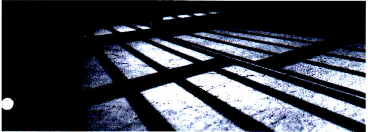
GCM prende acusado de portar arma de fogo Pag. 16