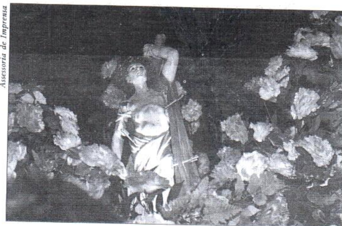
A programação da festa conta missas, procissões e shows