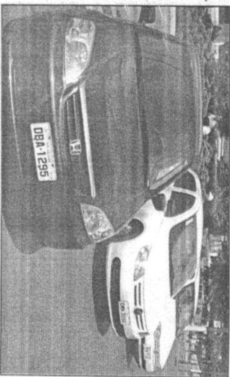
Os carros serão adesivados com identificação da Prefeitura

A Prefeitura de Ibiúna recebeu, no último dia 30, a doação de três veículos da Câmara Municipal, que serão