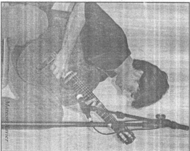
Assessoria de Imprensa

parceria entre a Prefeitura de Ibiúna, por meio da Secretaria de Cultura e Turismo, e Abacaj Cultura e Arte. Além de música