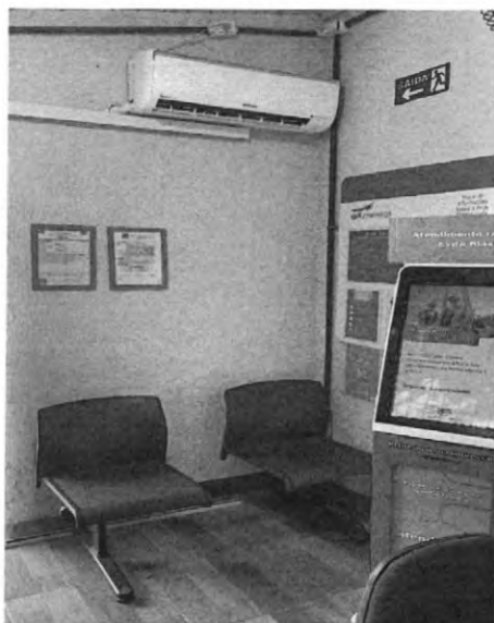
Climatização (instalação de ar-condicionado) e Instalação de Totem Autoatendimento