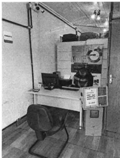
Ampliação do espaço interno