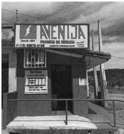
Rampa para acessibilidade