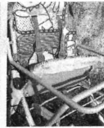
QUEM VÊ DE PERTO

Hoje os materiais estão devidamente armazenados e estão sendo separados para a realização do leilão.