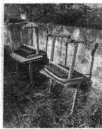
QUEM VÊ DE LONGE