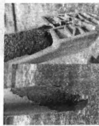
QUEM VÊ DE PERTO