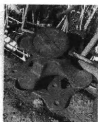
QUEM VÊ DE LONGE

Segue algumas fotos para compararmos o que foi publicado e o que de fato é: