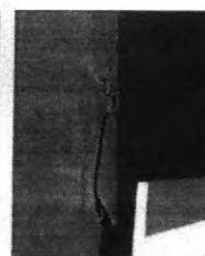
QUEM VÊ DE PERTO