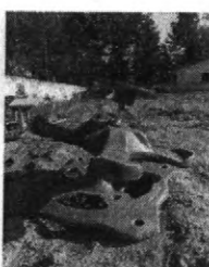
QUEM VÊ DE PERTO