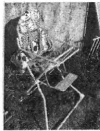
QUEM VÊ DE LONGE